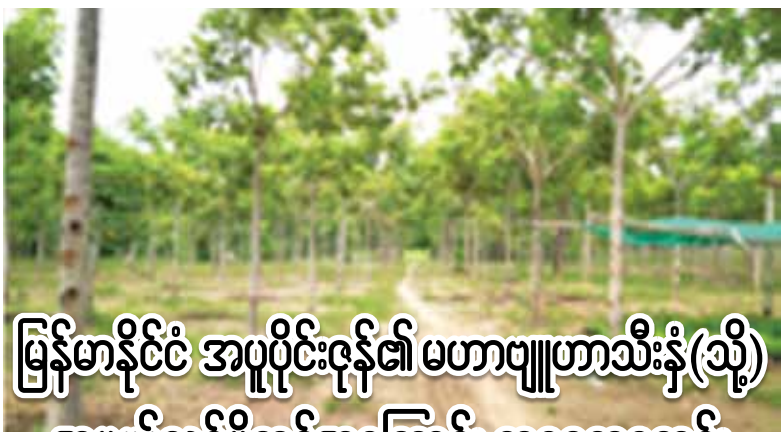
မြန်မာနိုင်ငံ အပူပိုင်းဇုန်၏ မဟာဗျူဟာသီးနှံ(သို့) အမယ်သစ်ပို့ကုန်အကြောင်း တစေ့တစောင်း